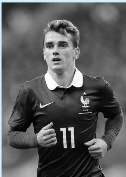
O francês Griezmann é do Atlético

O melhor jogador é escolhido conforme combinação de alguns critérios: 50% são referentes a votos de capitães e treinadores de todas as seleções do mundo. O voto popular representa 25%, enquanto os outros 25% vêm de 200 jornalistas escolhidos entre os seis continentes. Maior vencedora da história do prêmio da Fifa de melhor jogadora do mundo, com cinco troféus, mas fora inclusive da lista das indicadas no ano passado, Marta voltou a figurar entre as