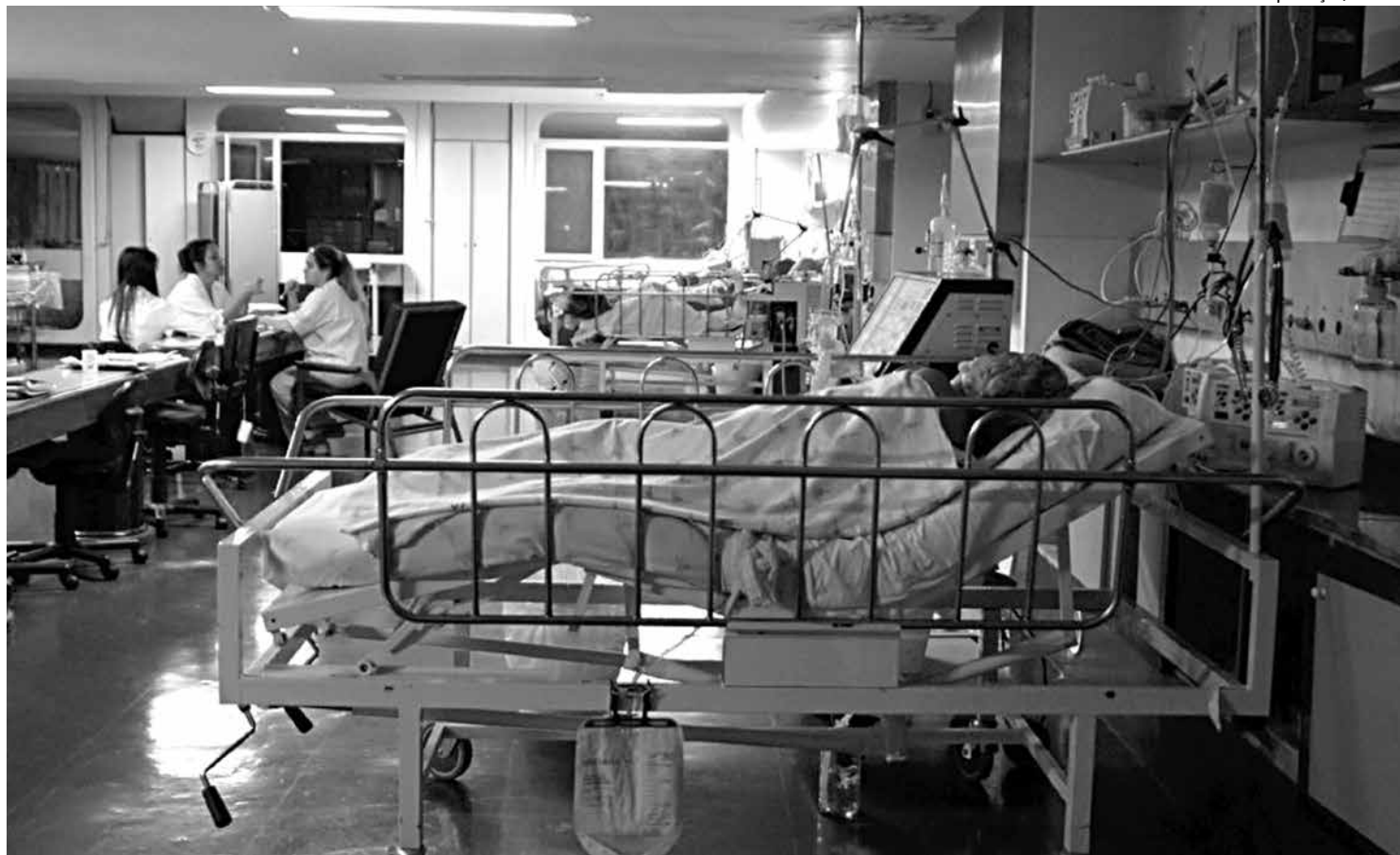
A medida é uma punição devido a reclamações recebidas no terceiro trimestre de 2016 e relativas à cobertura assistencial dos planos