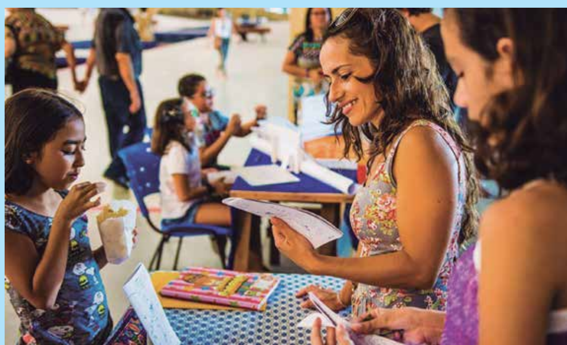
Diversas atividades para as crianças estão programadas no evento, que ocorre hoje

Arrecadação de gibis - Além das atividades, haverá arrecadação de gibis para a biblioteca Ariano Suassuna, localizada na Escola Municipal Cônego João de Deus. Após a visita dos alunos da escola à Gibiteca Henfil no Espaço Cultural em 2015 e as aulas de leitura na própria biblioteca da escola, as professoras