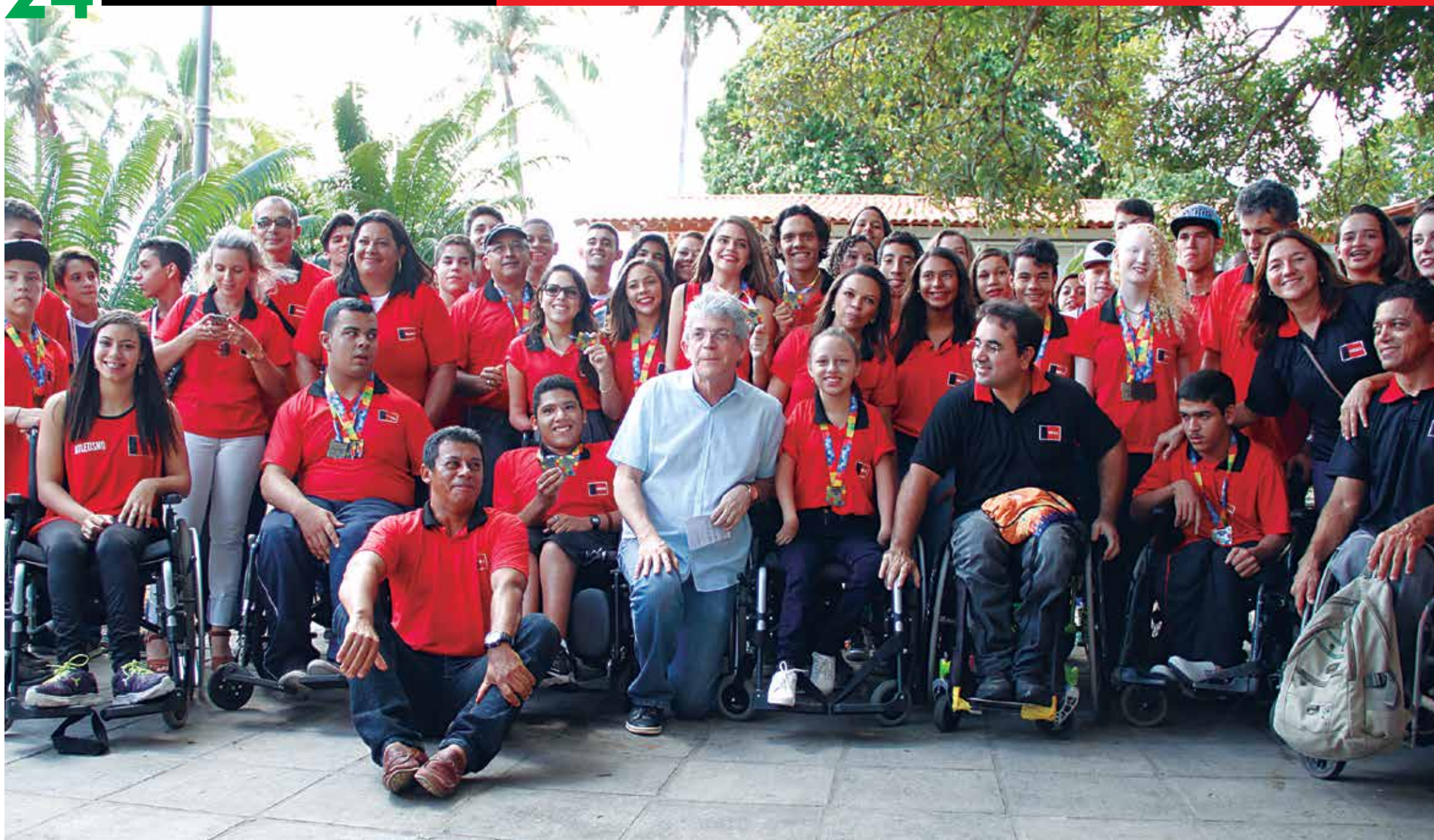
O governador posou para fotografia entre atletas e paratletas que representaram o Estado nos Jogos Escolares da Juventude, realizados em João Pessoa, e nas Paralimpíadas Escolares, em São Paulo