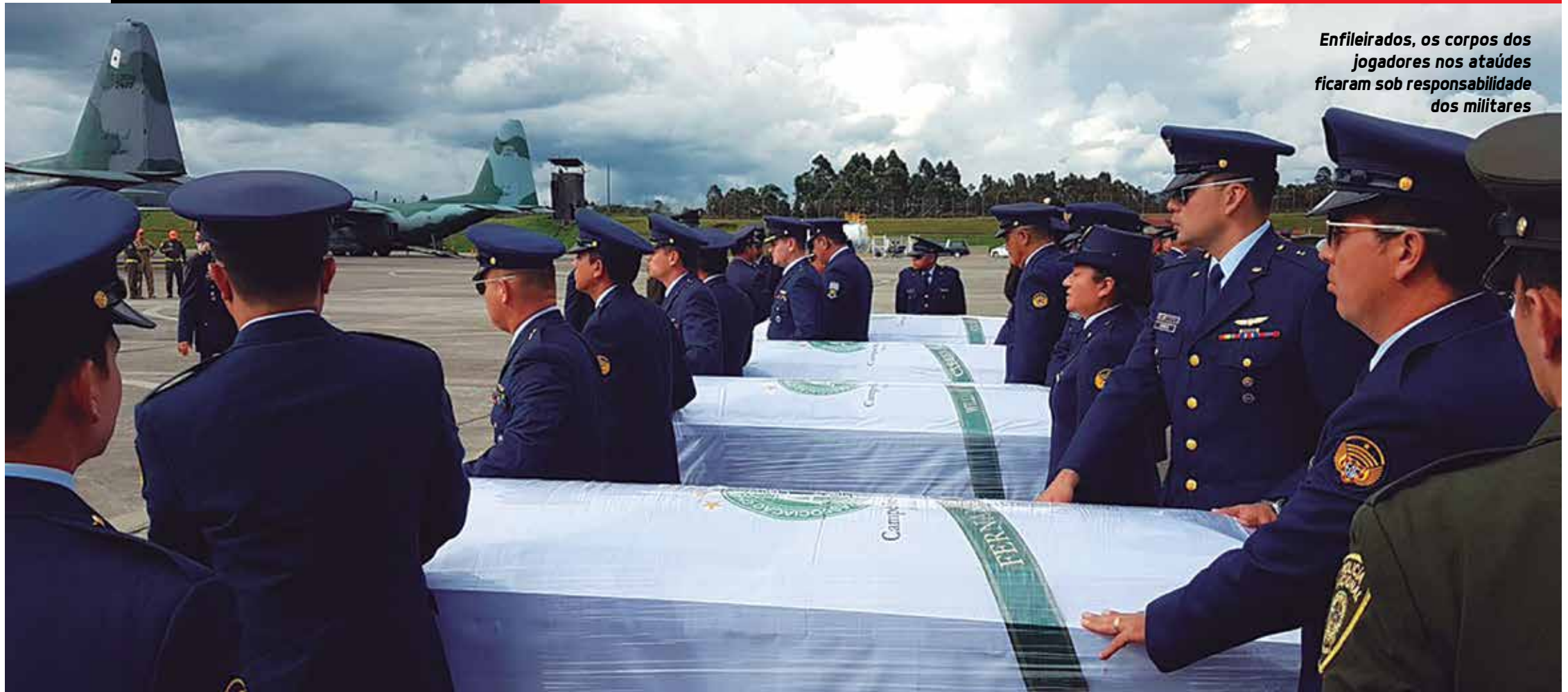
Enfileirados, os corpos dos jogadores nos ataúdes ficaram sob responsabilidade dos militares