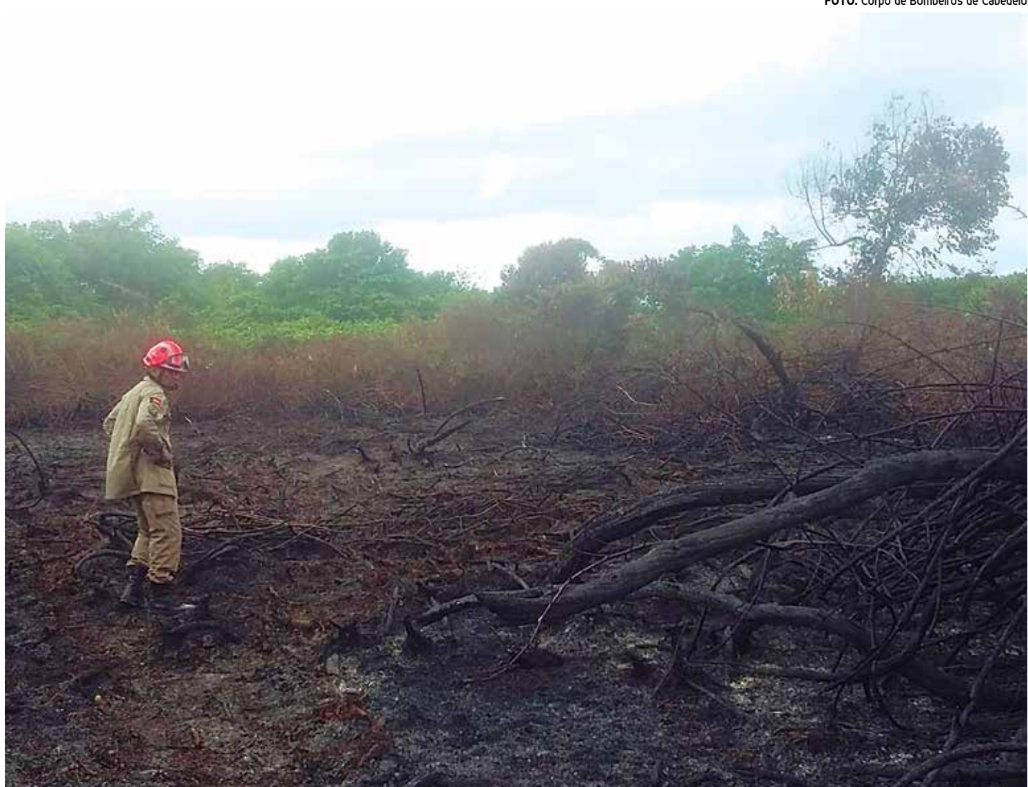
Incêndio aconteceu em vegetação de mangue às margens do Rio Jaguaribe, em área considerada de preservação permanente

Os trabalhos devem se encerrar no dia 11, com um evento que oferecerá atrações culturais, gastronômicas e artesanato. No encerramento do evento, o Iphaep vai homenagear os padrinhos e colaboradores do Acordo Cultural.