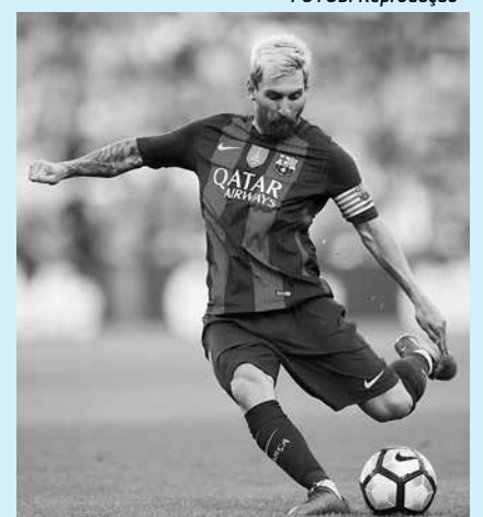
Lionel Messi, o craque do Barcelona

Lloyd, por sua vez, foi o grande nome dos Estados Unidos no título do Mundial de 2015, mas desta vez suas boas atuações