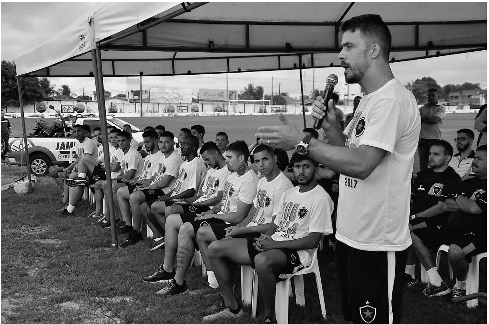
Jogadores do Belo, que vão disputar a Copa do Brasil de 2017, foram apresentados à torcida na última quinta-feira no Centro de Treinamento da Maravilha do Contorno

Para a quinta fase irão os 5 clubes classificados, mais as 7 equipes brasileiras que vão disputar a Libertadores deste ano, o campeão da Copa Sul-Americana, que deverá ser a Chapecoense, e mais os campeões deste ano da Copa do Nordeste, Santa Cruz, da Copa Verde, Paysandu, e do Campeonato Brasileiro da Série B, Atlético Goianiense. Serão as oitavas de final, com 16 agremiações. A partir desta fase, a competição segue no sistema de mata-mata, com sorteios de mando de campo, gol qualificado e divisão de rendas, semelhantes as fases anteriores, até o final.