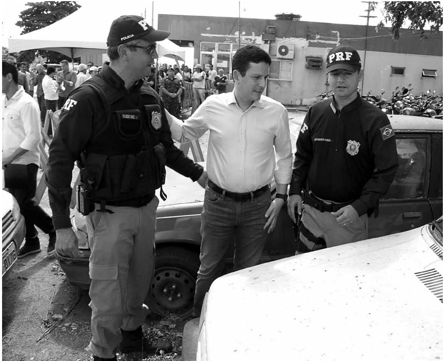
O ministro Bruno Araújo visitou o Posto da PRF em Bayeux e autorizou leilões de veículos que estão no pátio da instituição

O alerta do Ministério da Saúde é que a partir de agora até o mês de abril, o Aedes aegypti torna-se ainda mais perigoso, principalmente para mulheres grávidas nos três primeiros meses. Então, este é o momento de toda a população redobrar os cuidados para eliminar os mosquitos e destruir os criadouros.