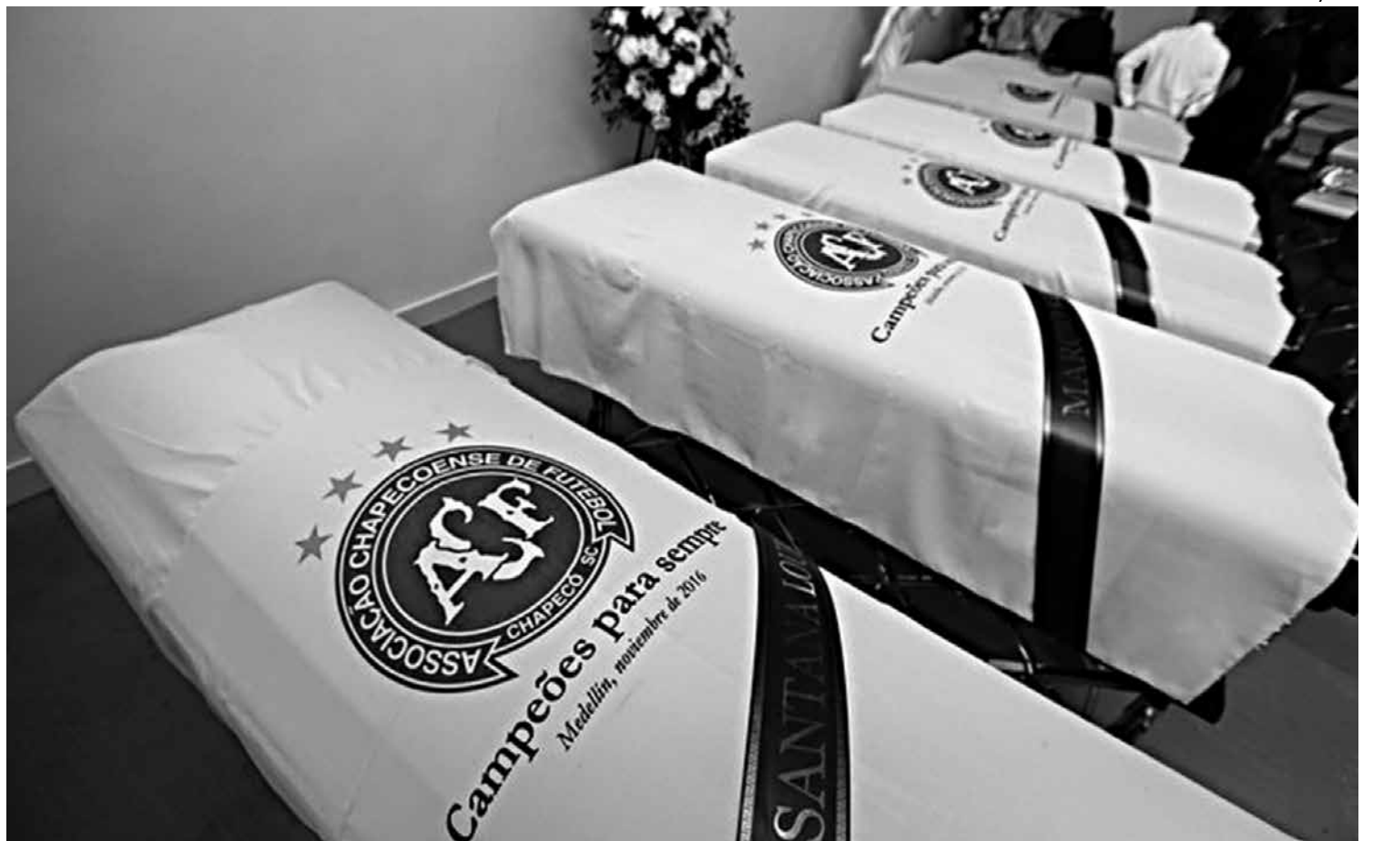
Caixões com os corpos dos jogadores, membros da comissão técnica, dirigentes e jornalistas chegam hoje pela manhã a Chapecó

"É uma das maiores operações da cidade. Serão 20 mil pessoas dentro do estádio e 100 mil no total. Teremos telões na área externa para as pessoas acompanharem. É muito doloroso, mas Chapecó vai dar conta, vamos conseguir nos reerguer",